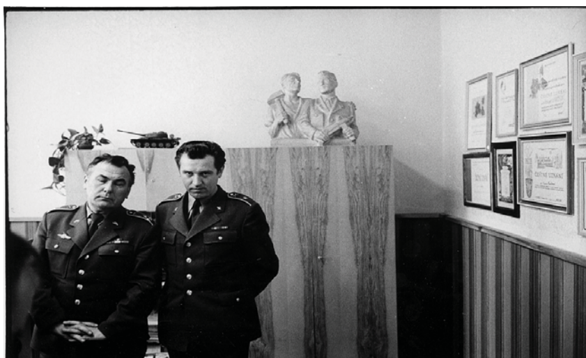
Libavá - 1980

Při zobrazování reality mu napomáhala jeho práce v projekci Severomoravských státních lesů, kam přešel v roce 1963 z Okresního stavebního podniku. Z důvodu neplnění stranických úkolů a následného požádání o výstup z komunistické strany byl ve stavebním podniku degradován z vedoucí pozice na místo pouhého projektanta spojené s výrazným snížením platebních podmínek. Stále vzrůstající napětí a nedůvěra k jeho osobě začala být nesnesitelná, a proto se rozhodl toto zaměstnání opustit. Práce projektanta státních lesů mu zajistila odpovídající finanční podmínky a také pocit volnosti, který mu umožňoval zcela zapomenout na komunistický režim a dodržování jeho zásad. Působení v novém zaměstnání mu umožňovalo pořizovat cenné dokumenty se záběry Severomoravského kraje, neboť při výstavbě nových silnic či domů byla zapotřebí jeho přítomnost v nejrůznějších místech této oblasti. S fotoaparát v brašně cestoval a pořizoval snímky i z míst, kam se obyčejný člověk jen stěží dostal. Například byl vyslán svým zaměstnavatelem do vojenského prostoru Libavá, kde se měly stavět bytovky pro zdejší vojáky. Při projednávání záležitostí kolem výstavby se ocitl v kanceláři zdejšího velitele. Toto prostředí na něj velice zapůsobilo, neboť všude na zdech visela ruská vyznamenání. Požádal velitele,